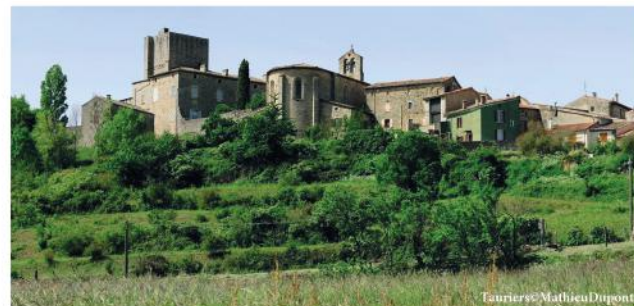
Tauriers - Mathieu Duport

Le budget prévisionnel 2019 de la communauté de communes du Val de Ligne voté à l'unanimité mi-avril affirme la volonté des élus communautaires de participer à construire solidement l'avenir du territoire. Il répond au cap fixé en début de mandat en priorisant les investissements structurants : l'implantation d'un pôle enfance-jeunesse en plein cœur du centre-bourg du territoire, le déploiement de la fibre pour tous ou encore l'aménagement de la voie verte infrastructure utilitaire, de loisirs et touristique. Le budget général s'élevait à 5 686 000€ et s'équilibrant parfaitement fait donc la part belle à l'investissement en lui consacrant 3 218 000€ ; 2 400 000€ sont dédiés au fonctionnement. Malgré une baisse des dotations, la collectivité a fait le choix cette année de ne pas augmenter la fiscalité. En toute transparence, dans ce nouveau numéro du Journal d'Info du Val de Ligne je vous invite à prendre connaissance du budget et des actions de votre communauté de communes.