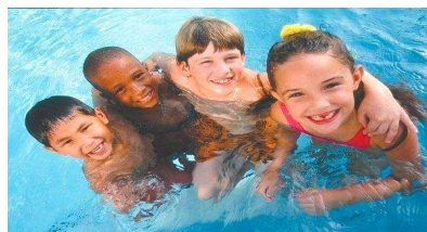
Piscine pour les 7 - 12 ans