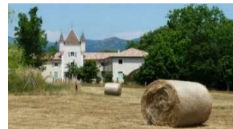
Atelier 1 : entre deux eaux

Journée au Parc National Régional des Monts d'Ardèche à Jaujac