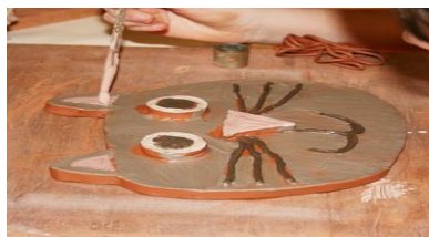
Poterie avec Gisèle 4 - 6 ans